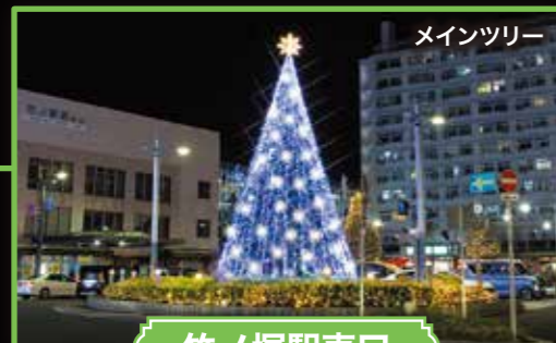
メインツリー 竹ノ塚駅東口 メインツリーが皆さまをお迎えます。

サンタやトナカイのコスプレをして写真を撮ろう! 期間中の金・土・日曜日は、元洲江公園でコスプレ 衣装の貸し出し(無料)もあります。 【貸し出し時間】17:00~21:00 【サイズ】子ども用 【貸し出し場所】ジープ、ソリ、馬車