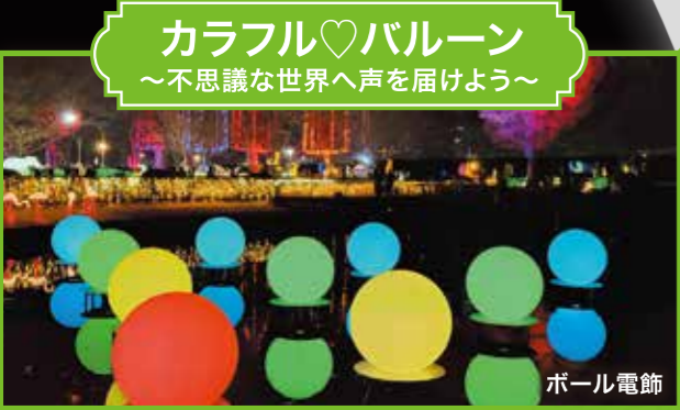
カラフル♡バルーン ～不思議な世界へ声を届けよう～ ボール電飾