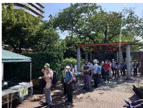
東武健康ハイキング

(ウ)今回実施したスタンプラリーは参加者からも好評だったため、次回以降の実施についても、沿線自治体と相談のうえ検討していく。