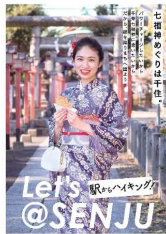
「七福神めぐりは千住。」