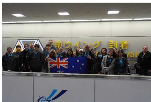
来日時の成田空港