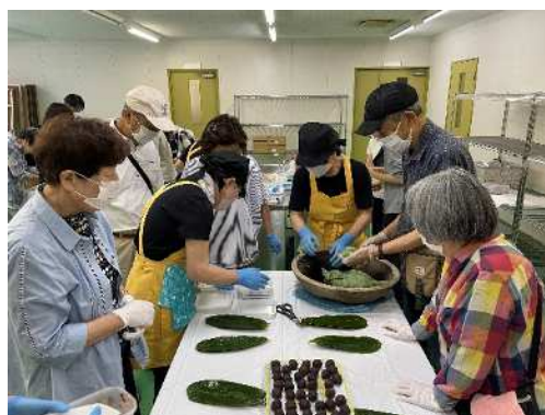
笹団子づくり体験