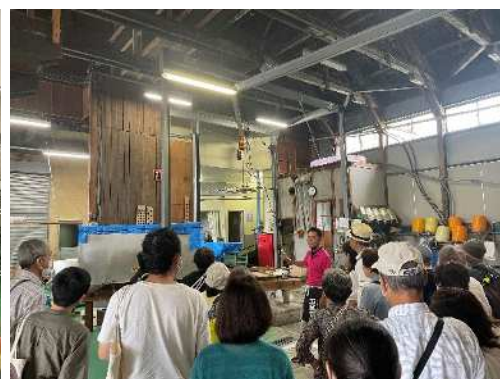
ガイドの様子(魚沼醸造)