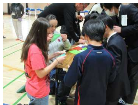
青井中学校との交流の様子