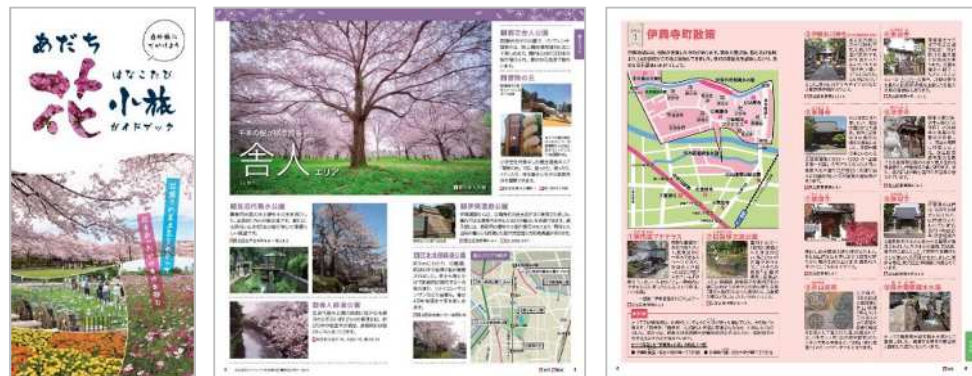
あだち花小旅ガイドブック

令和6年度は、別に作成予定の(仮称)マップ付区内観光ガイドブックとの差別化を踏まえ、作成について検討していく。