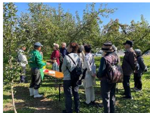
信州フルーツランド