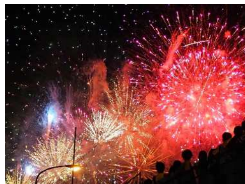
準グランプリ「花火」