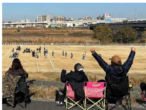
グランプリ「勝った～」