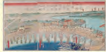
橋本貞秀「日光御街道千住宿日本無類橋橋杭之風景本願寺行粧之図」

千住宿は、江戸と日光を結ぶ「將軍家の参道」として整備された、日光街道最初の宿場です。東海道の品川宿、中山道の板橋宿、甲州街道の内藤新宿とともに江戸四宿と呼ばれていました。1844年の記録によると、千住宿の人口は9,956人で、その規模は江戸四宿の中でも群を抜いていました。