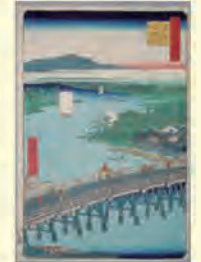
歌川広重「名所江戸百景 千住の大はし」

1625年に誕生した千住宿は、2025(令和7)年に開宿400年という大きな節目を迎えます。千住の街並みは当時から様変わりしていますが、時代が移っても足立の顔であることは変わりありません。