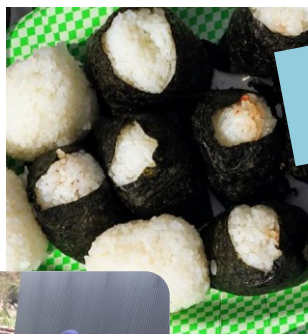
←福山コシヒカリの新米おむすび おどろきの旨さ!