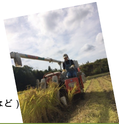
山の暮らしを体験しよう

【持ち物】作業着 (長袖), 長靴, 帽子, 手袋, 雨具, 上着, 着替え 健康保険証など