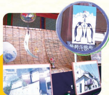
蔵の残る街、千住・夏

魚屋さん時代、 ここには活きのいい魚が 並んでいた… 今では季節ごとに変わる 素敵なショーウィンドウに。